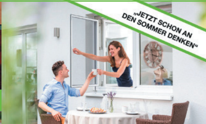
Insektenschutzfenster zum Öffnen