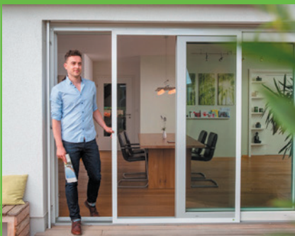
Schiebetüre zum Öffnen