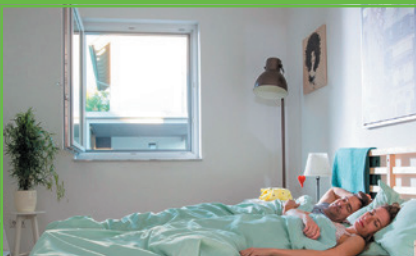
Pollenschutzgitter für Allergiker