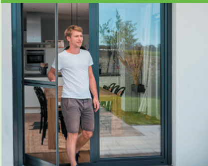
Pendeltüre nach Maß

info@insektenschutz-coenen.de www.insektenschutz-coenen.de